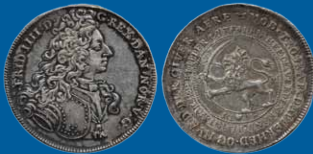
278 NM 91C Frederik IV 6 mark (resedaler) 1704. 26,84 g. Liten repa framför näsan i fältet på åtsidan.