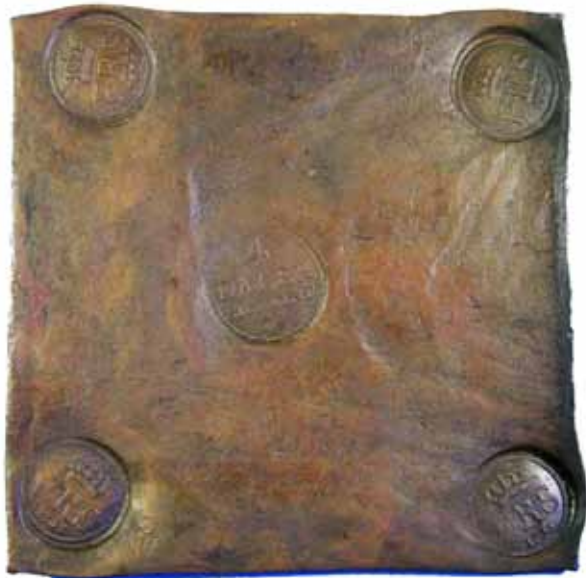
58 40 %