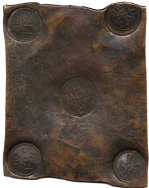
59 40 %

58 SM 198 4 daler SM (plåtmynt) 1735. 3010 g. Tilltalande plåt!