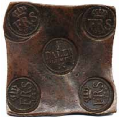
62 50 %

60 SM 252 1 daler SM (plåtmynt) 1731. 775 g. Obetydlig ärgfläck.