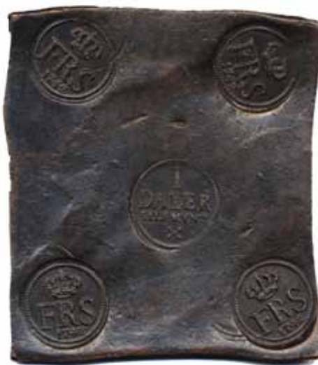
61 50 %