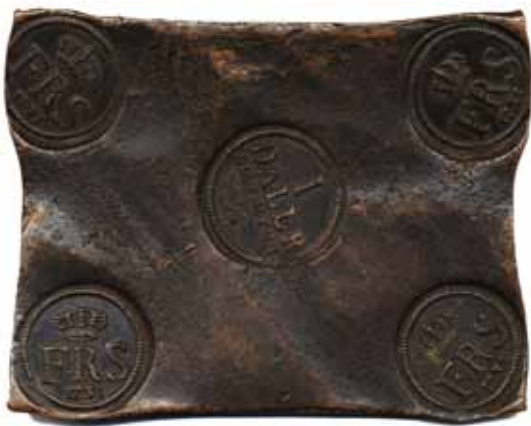
60 50 %