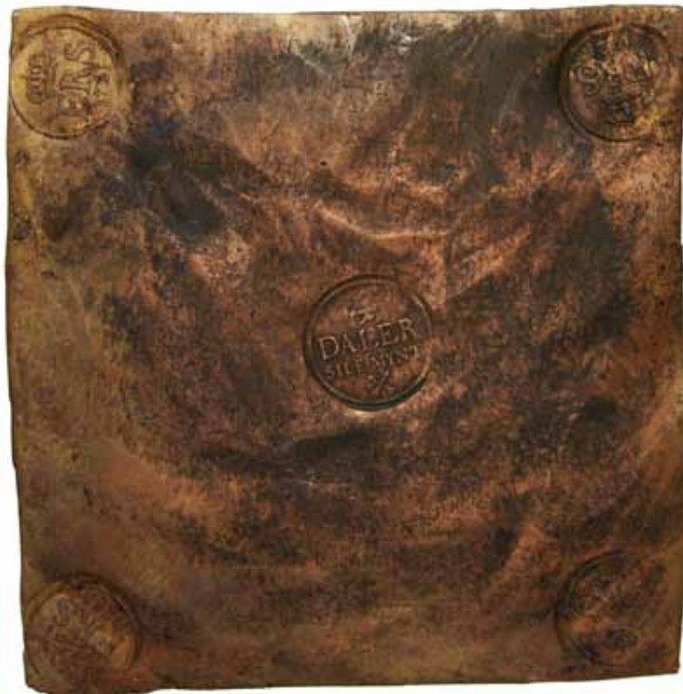
136 (50 %)