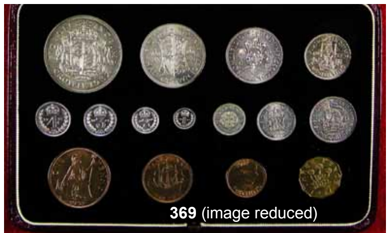
369 (image reduced)