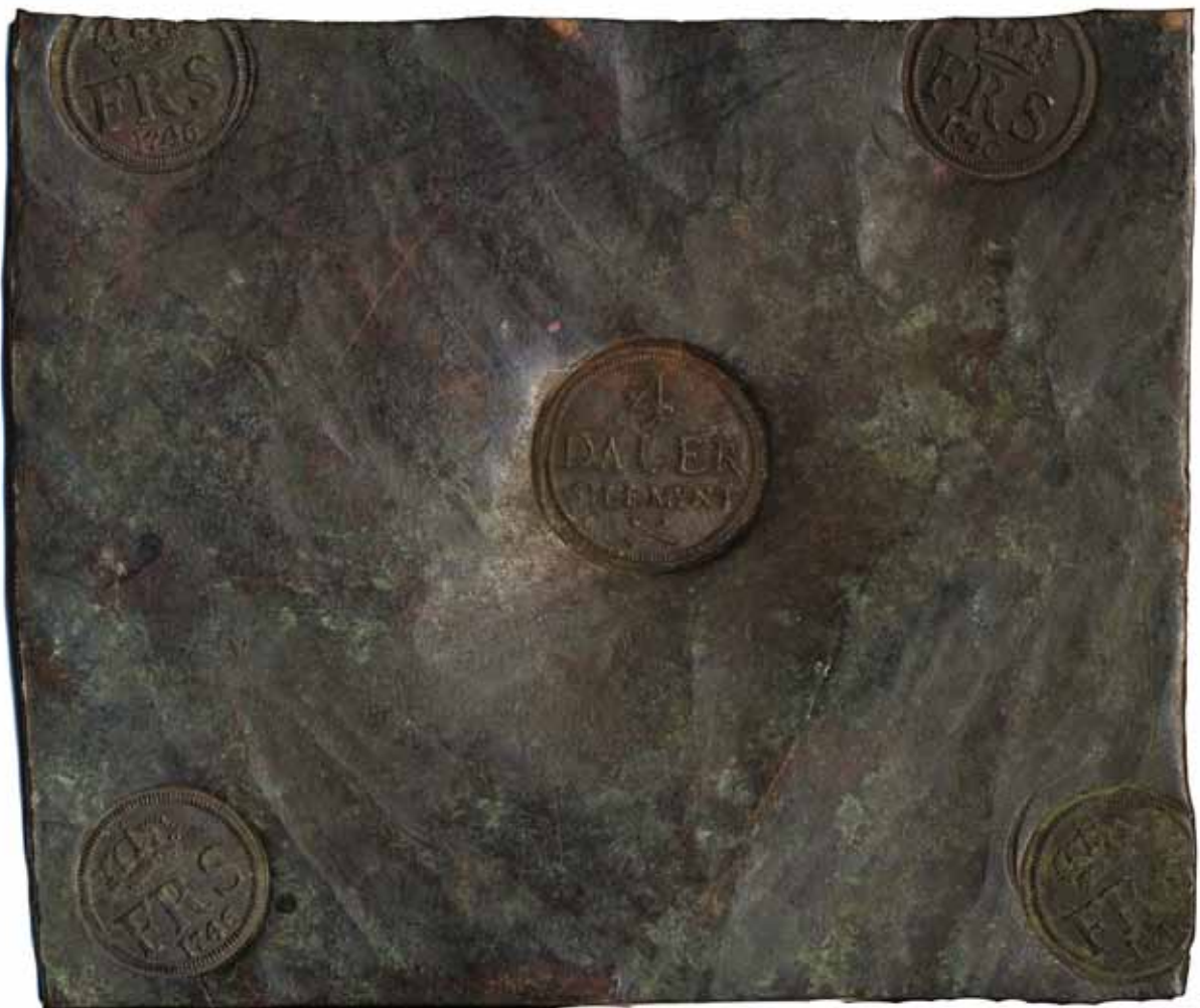
201 (65 %)

201 SM 209 4 daler SM (plåtmynt) 1746. 2900 g. Något ärg.