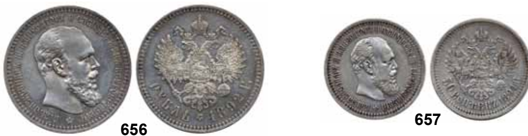
656 Bitkin 76 1 rouble 1892. 657 Bitkin 87 50 kopek 1894.