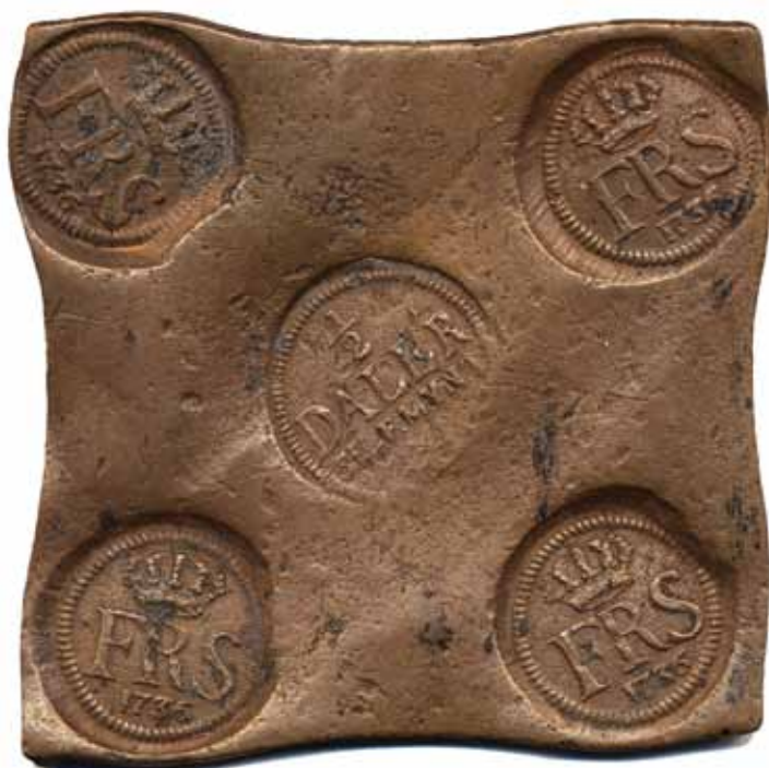
204 (90 %)

204 SM 288 1/2 daler SM (plåtmynt) 1736. 368 g.