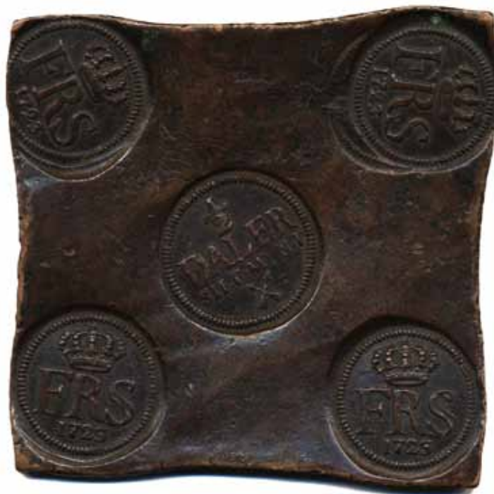
203 (90 %)

203 SM 275 1/2 daler SM (plåtmynt) 1723. 344 g. Vacker och tilltalande plåt med originalpatina.