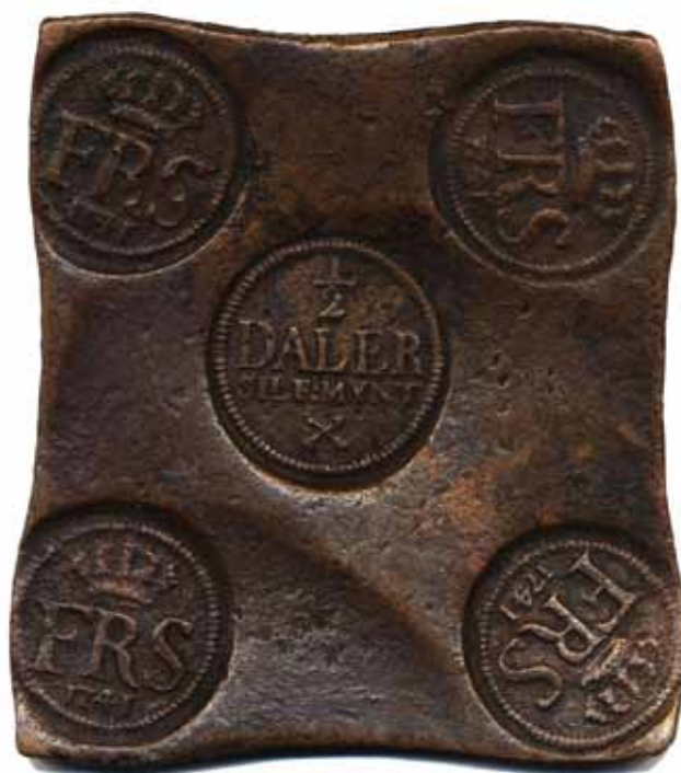
205 (90 %)

205 SM 293 1/2 daler SM (plåtmynt) 1741. 366 g. Viss korrosion i stämplarna.