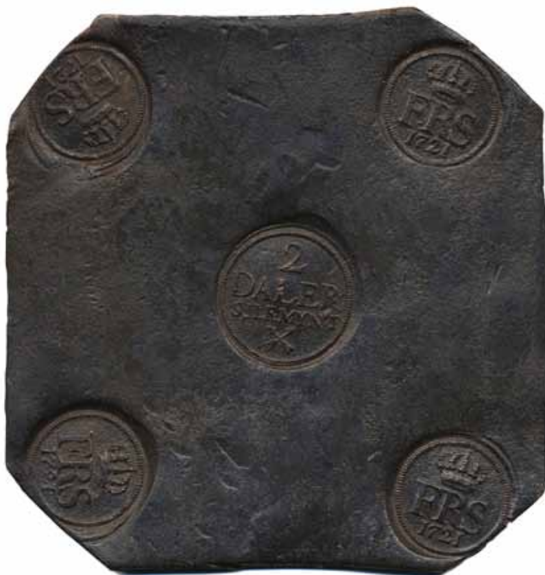
202 (65 %)

202 SM 211 2 daler SM (plåtmynt) 1721. 1516 g. Lätt korrosion, i övrigt en mycket tilltalande plåt med jämn fin patina.